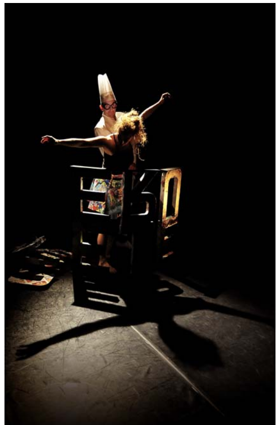
© Reveïda - Esperluette Danse avec la Peau des Mots - photo : Rémy Masségli