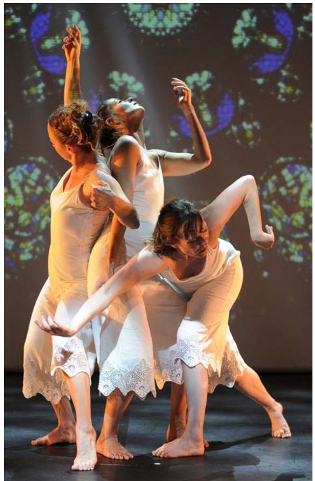
© Reveïda, Le Kaléidoplastique Quizz photo : Nathalie Sternalski

Les Petites Graines (2022) Performance conçue pour la salle de classe, dès le CP.