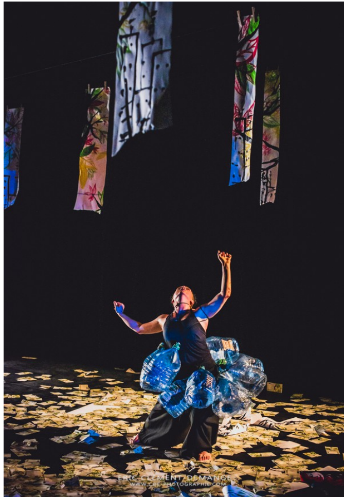
© Reveïda, Nous n'irons Plus au Bois photo : Eric Clément-Demange

Elle démarre son expérience professionnelle avec les arts de la rue qui lui ont donné le goût de l'adaptation, du présent toujours renouvelé et du questionnement sur la place du public.