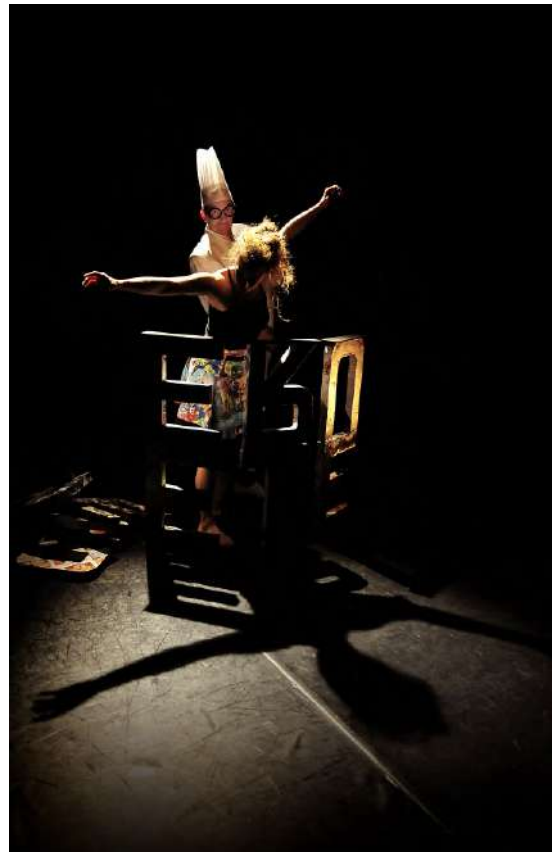
© Reveida - Esperluette Danse avec la Peau des Mots - photo : Rémy Masségli