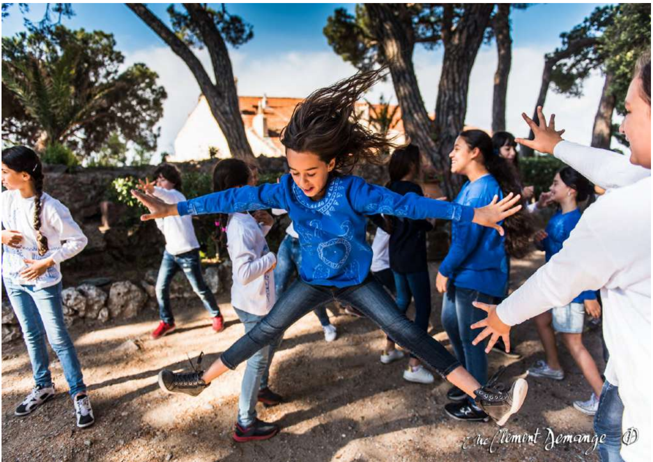
© Reveïda, A la manière Kaléidoplastique

Musée International de la Parfumerie à Grasse, ville de Cannes, réseau Canopé, DRAC PACA : réalisation d'un film de danse avec des enfants à partir d'une pièce de la Cie.