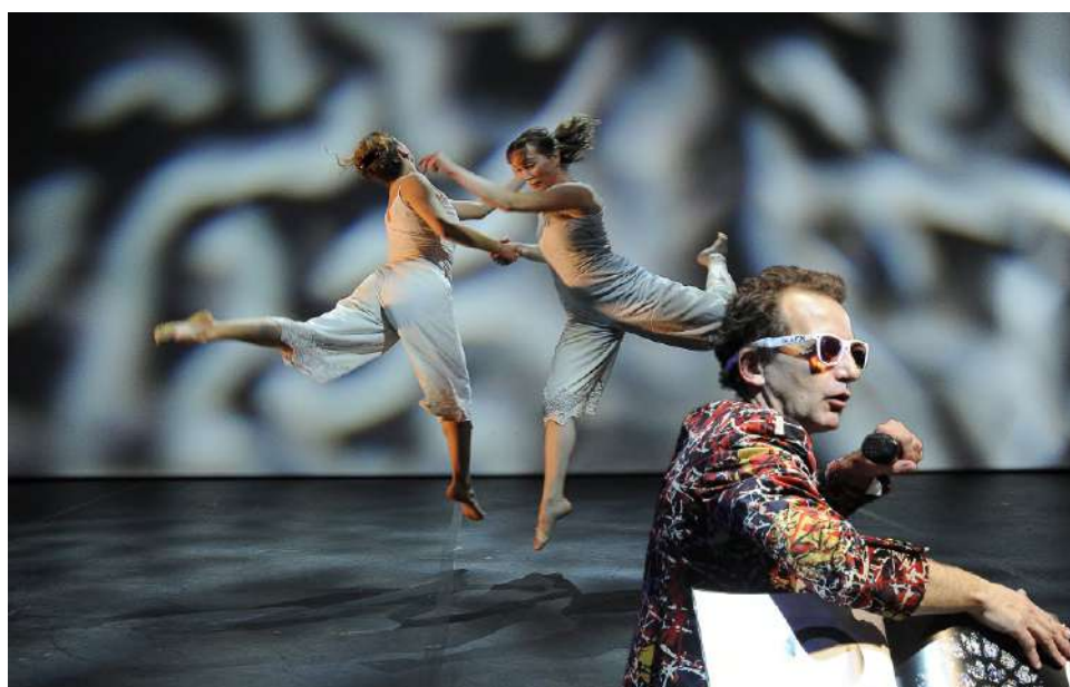
Le Kaléidoplastique Quizz

Les co-productions marquantes de la Cie Reveida depuis sa création : les Synodales de Fontainebleau en 2005, le Forum Jacques Prévert à Carros en 2008, le CCN de Roubaix - Carolyn Carlson en 2010, la Paperie, Centre National des Arts de la Rue en 2012, Résidences accompagnées à plusieurs reprises depuis 2010 : Entre-Pont (Nice), Fabrique Mimont (Cannes), système Castafiore (Grasse).