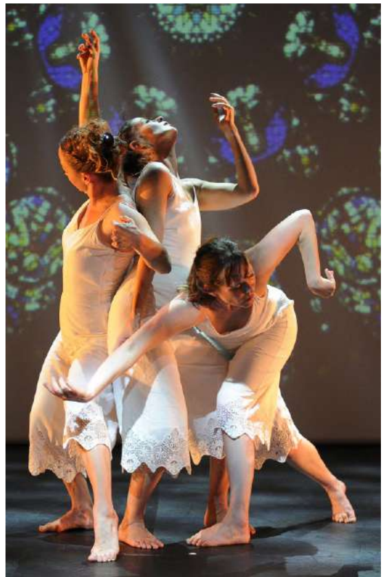
© Reveïda, Le Kaléidoplastique Quizz photo : Nathalie Sternalski

Les Petites Graines (2022) Adaptation de Nous n'irons Plus au Bois pour la salle de classe (à partir de la moyenne section)