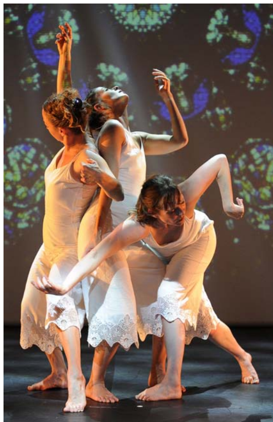
© Reveïda, Le Kaléidoplastique Quizz photo : Nathalie Sternalski

La Constellation des Petits Pois (2018) Fantaisie dansée au pays de la science, dès 6 ans.