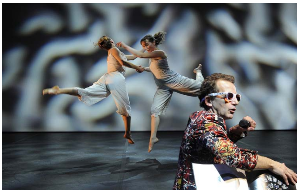
© Reveïda, Le Kaléidoplastique Quizz - photo : Nathalie Sternalski

Résidences accompagnées à plusieurs reprises depuis 2010 : Entre-Pont (Nice), Fabrique Mimont (Cannes), système Castafiore (Grasse).