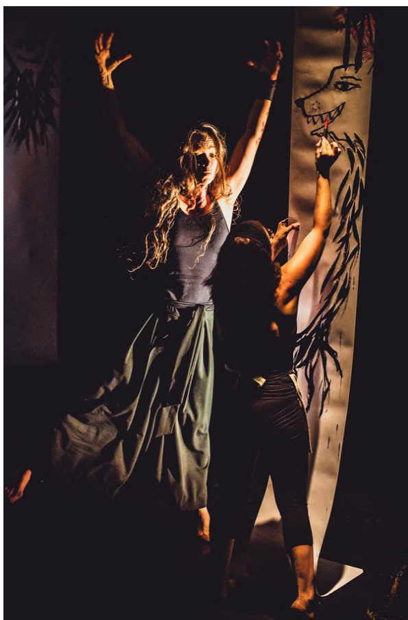
© Reveïda, Nous n'irons Plus au Bois photo : Eric Clément-Demange

La Cie Reveïda est accueillie dans divers lieux culturels du département 06 comme par exemple au Théâtre National de Nice (CDN) ou en résidences accompagnées : Entre-Pont (Nice), Fabrique Mimont (Cannes), système Castafiore (Grasse) et désormais à l'Espace Chorégraphique Chiris – Hervé Koubi (Grasse).