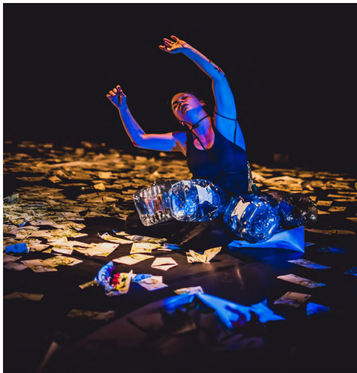
© Reveïda, Nous n'irons Plus au Bois photo : Eric Clément-Demange

Elle démarre son expérience professionnelle avec les arts de la rue qui lui ont donné le goût de l'adaptation, du présent toujours renouvelé et du questionnement sur la place du public.