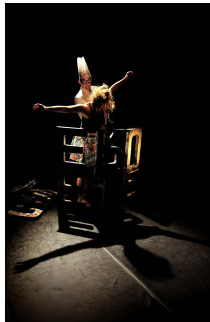
© Reveïda, Esperluette Danse avec la Peau des Mots - photo : Rémy Masségli

A L'école du spectateur Avignon le Off Geneviève Charras